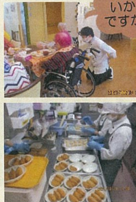
お味はいかがですか?

10月は「スポーツの秋・行楽の秋」運動会行楽メニューです。稲荷ずしはソフト食を含めて全て厨房で作成しました!