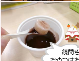
鏡開き おやつはお汁粉